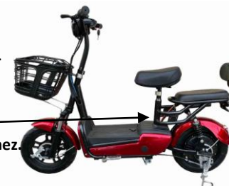
töltő csatlakozó aljzat

A főbiztosíték az akkumulátor dobozban belül került elhelyezésre meghibásodása esetén forduljon szakemberhez.